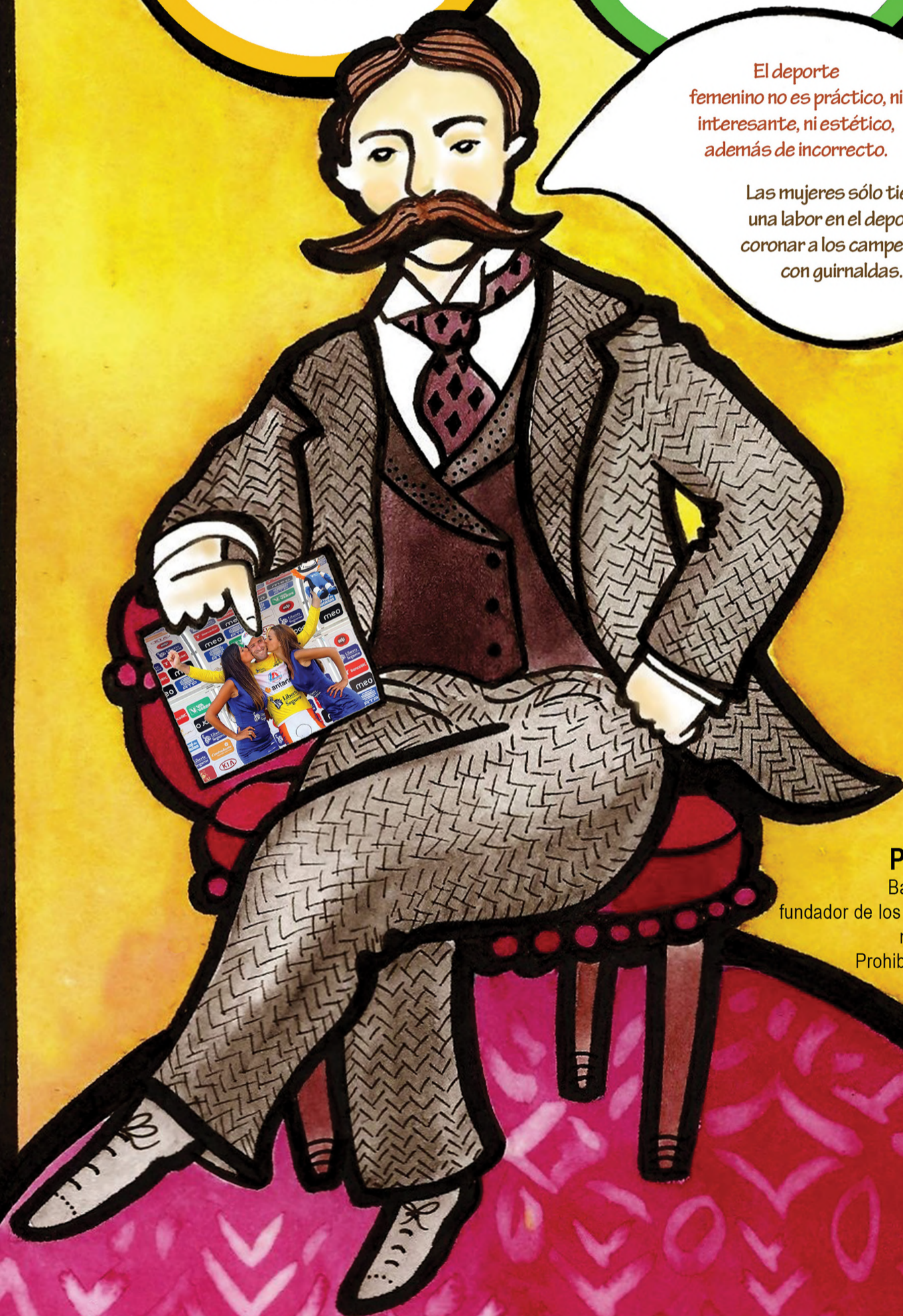
Pierre Fredy, Barón de Coubertin, fundador de los Juegos Olímpicos modernos en 1896 Prohibió tajantemente la participación femenina.

Las mujeres sólo tienen una labor en el deporte: coronar a los campeones con guirnaldas.